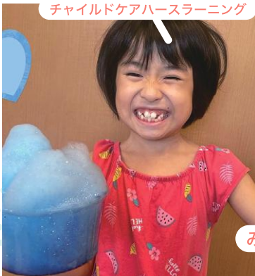
たくさんの泡を 作って遊びました。oO チャイルドケアハウ斯拉ーニング