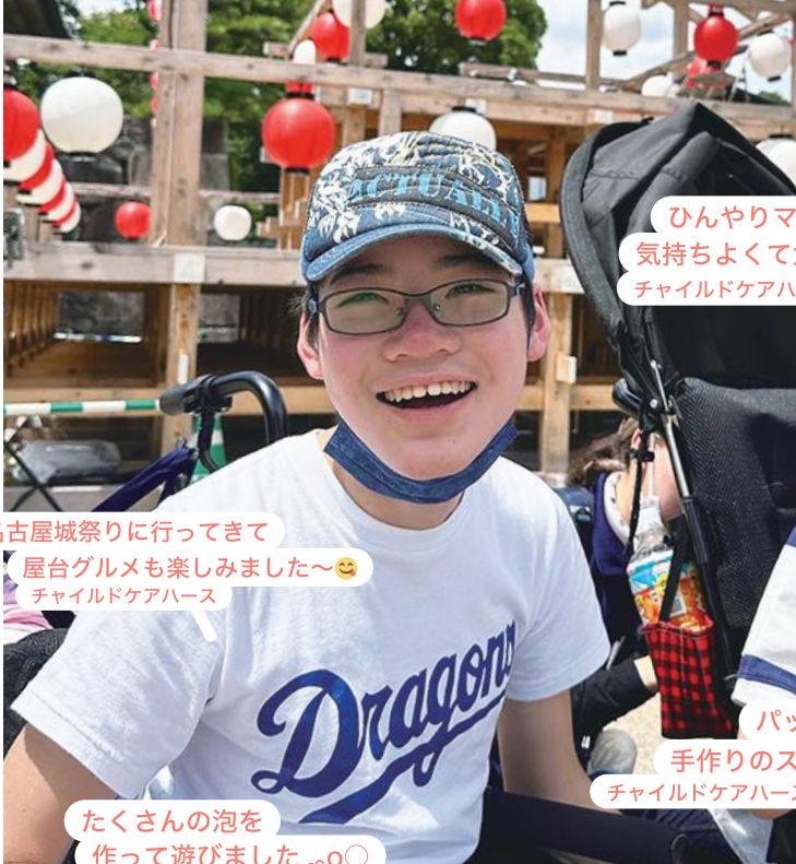
名古屋城祭りに行ってきた 屋台グルメも楽しめました〜 チャイルドケアハウス