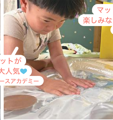
マットを使って 楽しみながらリハビリ♪ ナースケアハウス