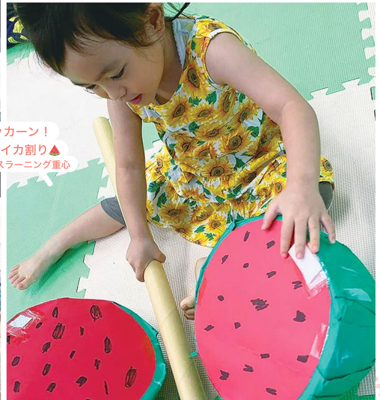
パッカン! 手作りのスイカ割り チャイルドケアハウ斯拉ーニング重心