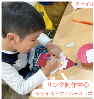
サンタ制作中◎ チャイルドケアハースラボ