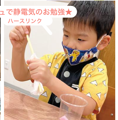
ティッシュで静電気のお勉強★ ハースリンク