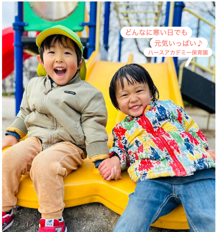
どんなに寒い日でも 元気いっぱい♪ ハースアカデミー保育園