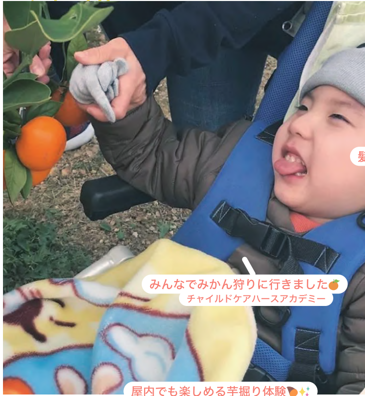
みんなでみかん狩りに行きました🍊 チャイルドケアハースアカデミー