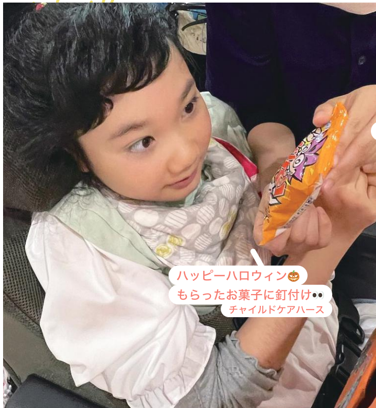
ハッピーハロウィン🎃 もらったお菓자에釘付け❗ チャイルドケアハース