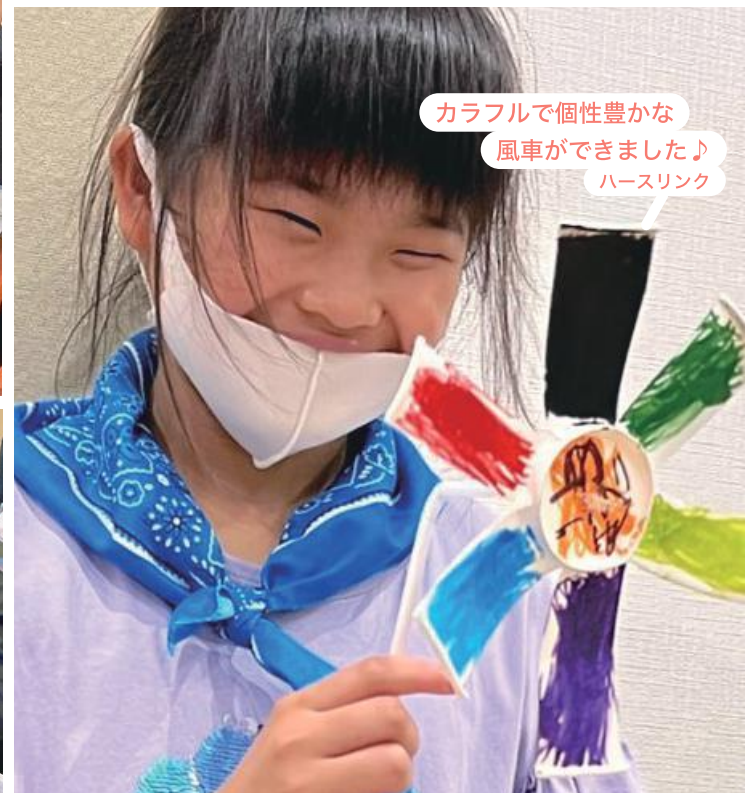
カラフルで個性豊かな 風車ができました♪ ハースリンク