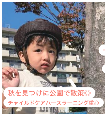
秋を見つけに公園で散策◎ チャイルドケアハースラーニング重心