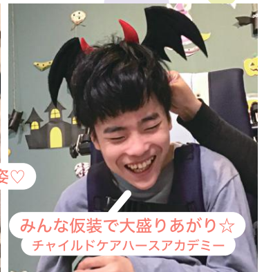
みんな仮装で大盛り上がり☆ チャイルドケアハースアカデミー