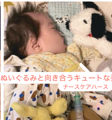
ぬいぐるみと向き合うキュートな姿♡ ナースケアハース