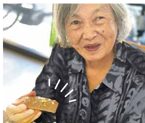
▲可愛いおやつに思わずニコリ😊

に並べられなかった商品を提供しているそうです。フードロス削減&ハース姉妹施設ならではの連携ですよね◎ プチ贅沢なティータイムでした♪ そんな名古屋滝ノ水店では10/28~11/6の期間に1周年イベントを開催します! 詳細は公式SNSで♪