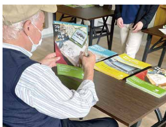
▲パンフレット折り作業。実際にハースのもの達も折って頂いているんです♪

天白区「原駅」徒歩3分の場所に就労継続支援B型『ハースリンク』が開所しました! 16種類から選べるパターンオーダー型のプログラムを取り入れ、幅広い特性とご希望に合わせた支援を行います。精神疾患や発達障がいなど働き辛さを感じている方々や、疾患などで今すぐの一般就労が難しい方などにご利用・ご検討いただいています。ハースの児童デイをご利用中の方にとっては、生活介護「デイサービスハース」や、こちらの「ハースリンク」が放課後等デイ卒業後の選択肢として入ってくるのではないのでしょうか(^o^)/ ハースリンクは相談員さん等を介さずにセルフプランとして直接ご連絡いただく方も多数です。ぜひお気軽にご相談くださいね♪