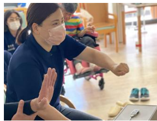
▲作業療法士のスタッフも体験！状態によって難易度を調整できます！

他にも手の平の動きを感知するセンサーも体験♪画面上の色々な果物を掴んで指定のカゴへ運び入れるゲーム。腕を前に伸ばして、手の平をグーにして果物をギュ！そのまま掴んでカゴまで移動します。この一連の動きは普段なかなか使わない筋肉を鍛えることができるそう！最初は笑顔だった利用者様も段々と真剣な表情に…記録更新された時は、すごく嬉しそうにされていました◎