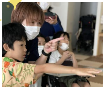
▲センサーに手をかざしてグー！パー！映像の中の果物を掴んで運んだよ☆

センサーの種類は全部で5つ。手足の動きのほか、視線や音声に反応する物も。指先のほんの少しの動きから腕や足の大きな動きまで感知するため、障がいを持った小さなお子さまから大人の方、そしてご高齢の方まで幅広い方が楽しめるものです！