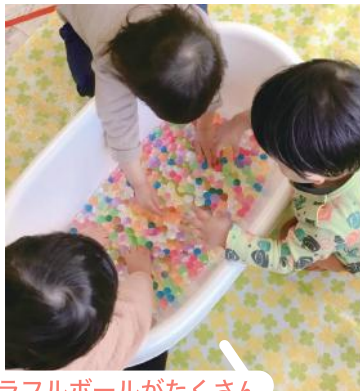
カラフルボールがたくさん