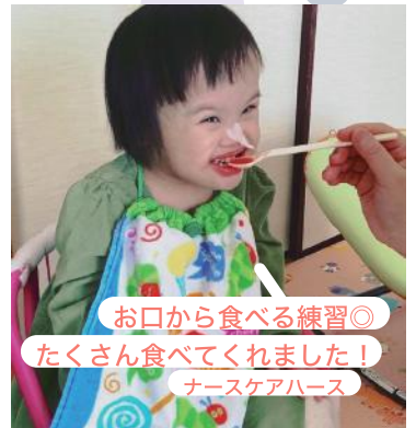
お口から食べる練習◎ たくさん食べてくれました！ ナースケアハース