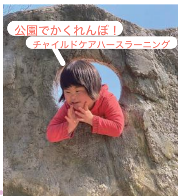
公園でかくれんぼ！ チャイルドケアハースラーニング