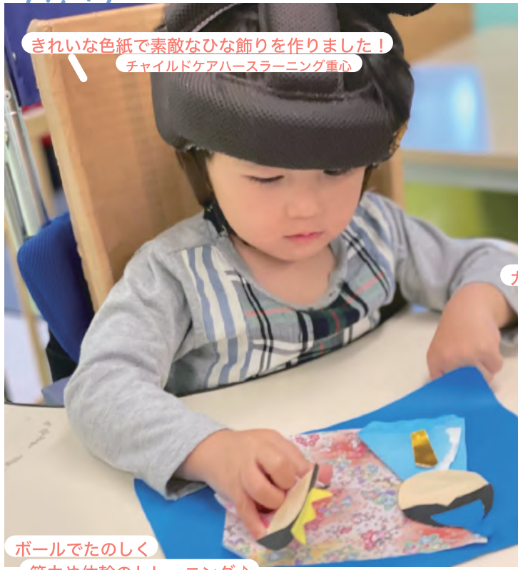
きれいな色紙で素敵なひな飾りを作りました！ チャイルドケアハースラーニング中心